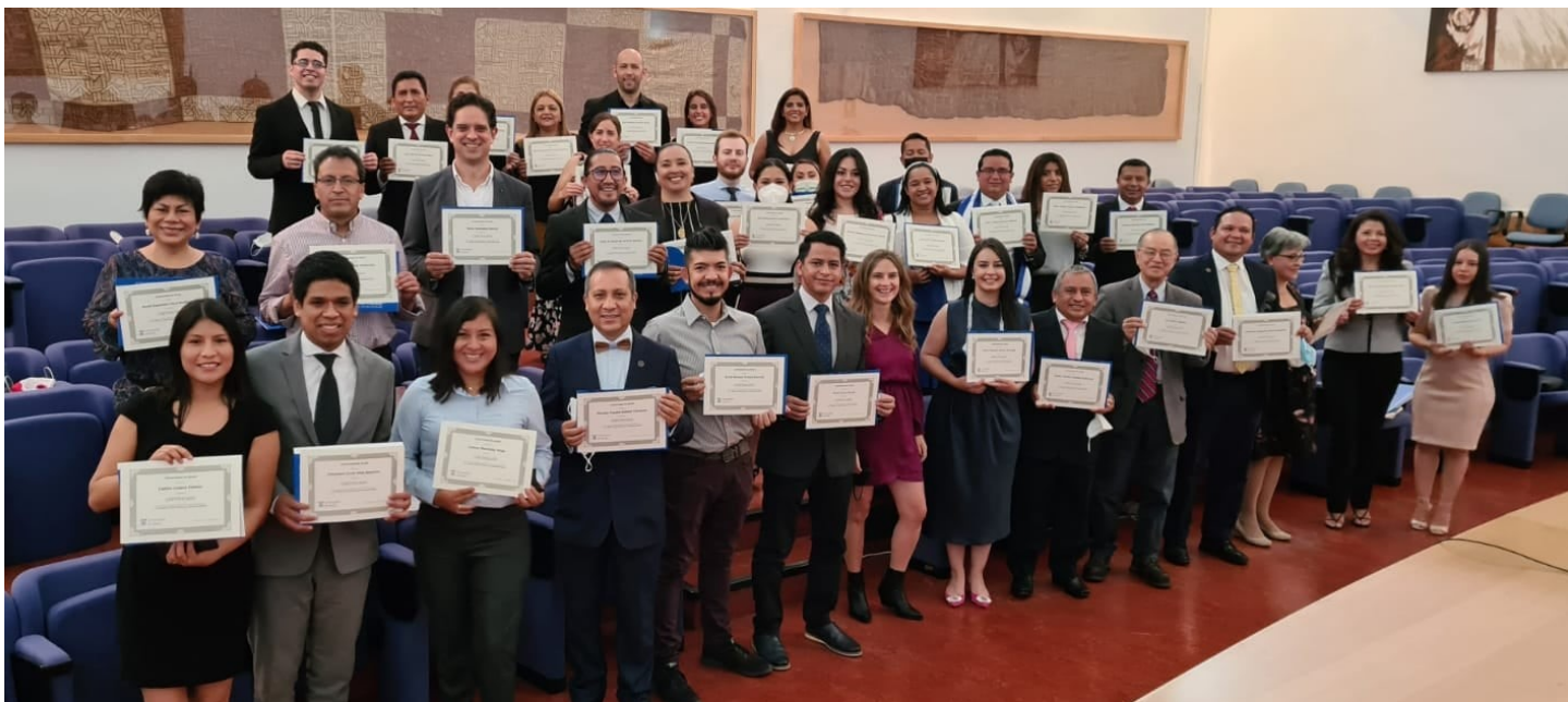
Alumnos del Máster en Microfinanzas y Desarrollo Social de la Universidad de Alcalá durante el acto de Clausura.

La pasada semana del 6 al 17 de septiembre de 2021, en la ciudad de Alcalá de Henares en la Comunidad de Madrid, se celebró la Fase Presencial del Máster en Microfinanzas y Desarrollo Social de la Universidad de Alcalá para dar clausura de la décimo segunda y tercera edición del máster. A la celebración asistieron 35 alumnos, provenientes de 10 países, que incluyen Bolivia, Brasil, Ecuador, Honduras, México, Nicaragua, Paraguay, Perú, República Dominicana y Uruguay.